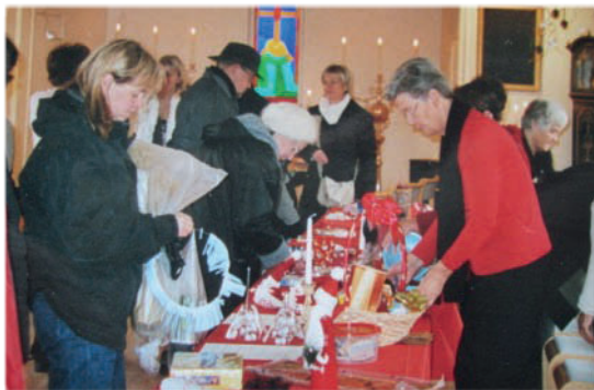
Kyrkans bazar 2005