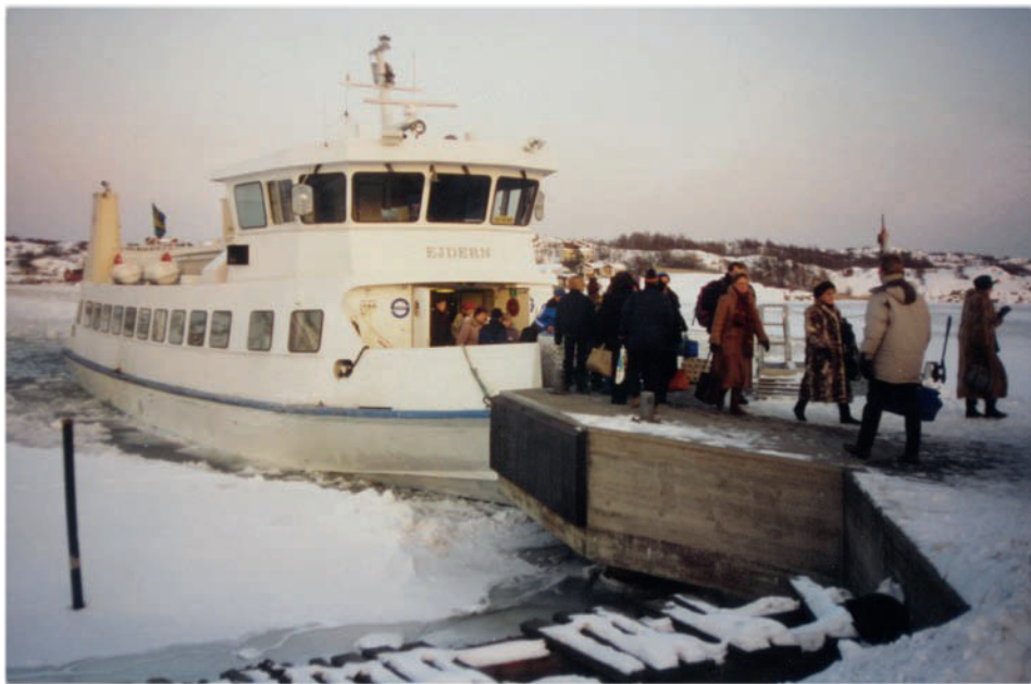
Ejdern 1995 vid Rödsten Skarven passerar unge herr Westberg