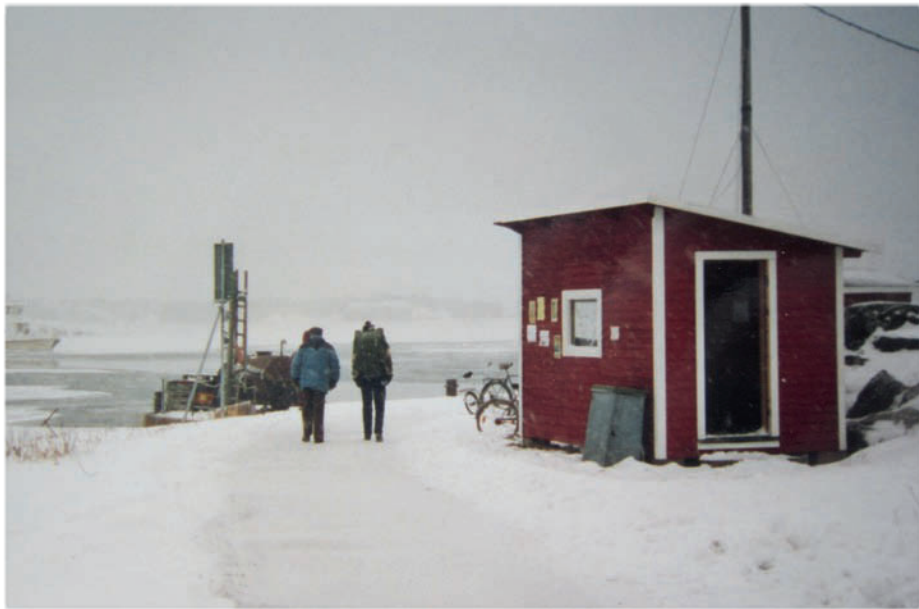
En tidigare väntkur i Husvik 1995.