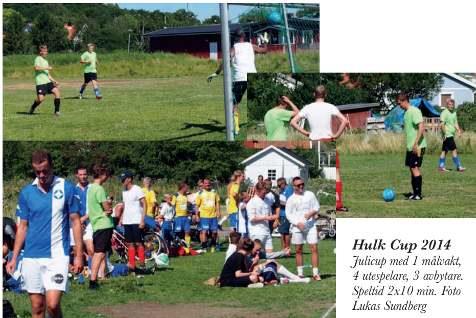
Hulk Cup 2014 Julicup med 1 målvakt, 4 utspelare, 3 avbytare. Speltid 2x10 min.