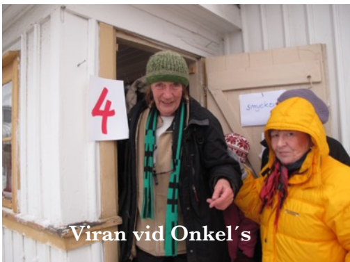
Viran vid Onkel's